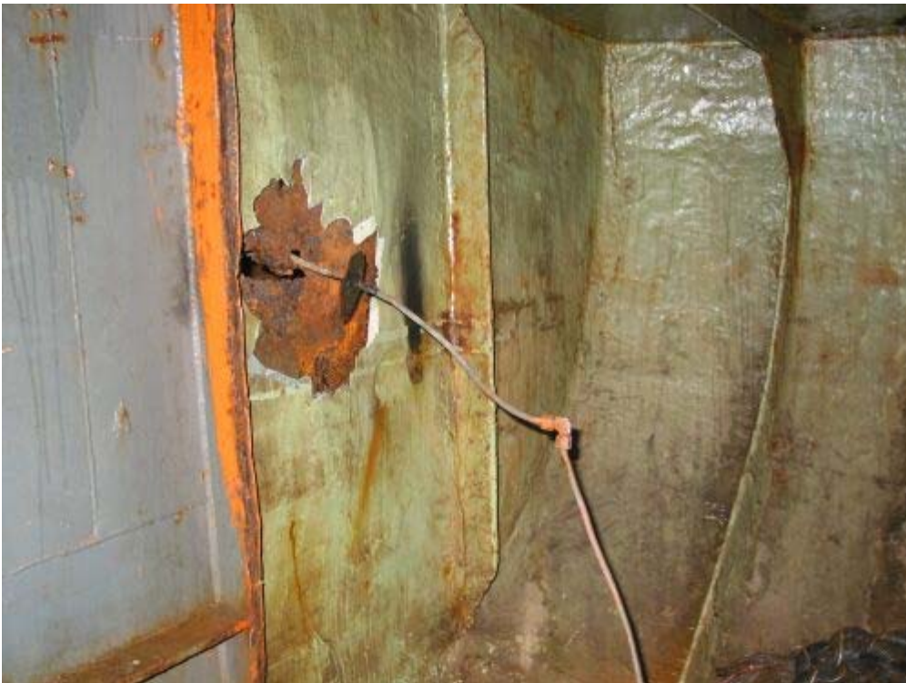
Abbildung 5, Stauraum Bb. achtern