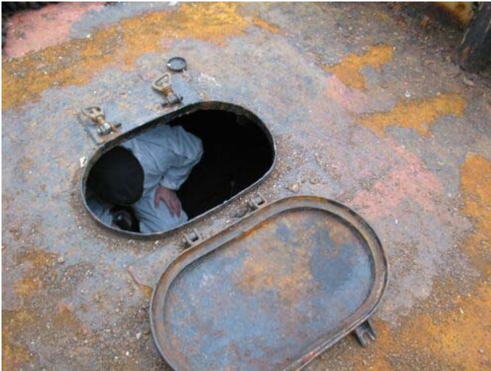
Abbildung 2, Mannloch Achterpiek