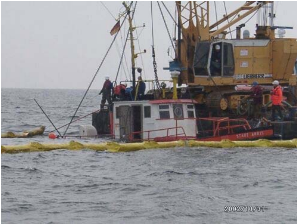
Abbildung 8, Bergung vom 31.10.2002