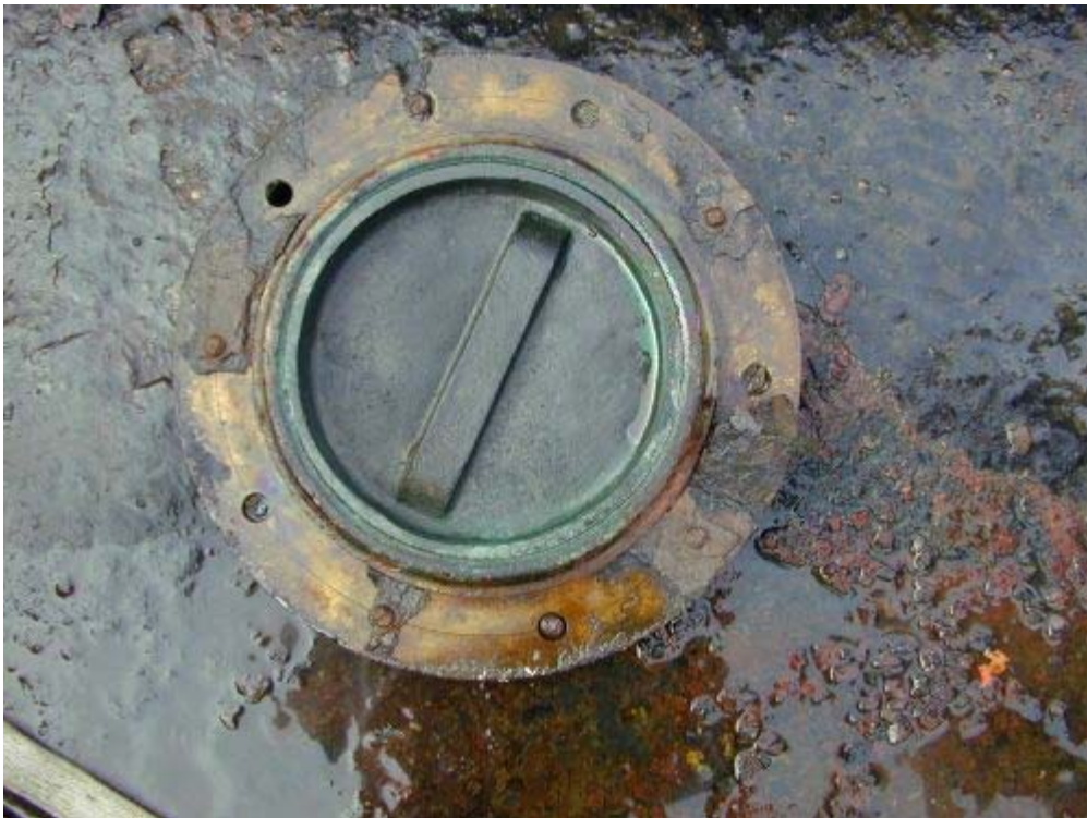
Abbildung 3, Hauptdeck Bb.-Seite