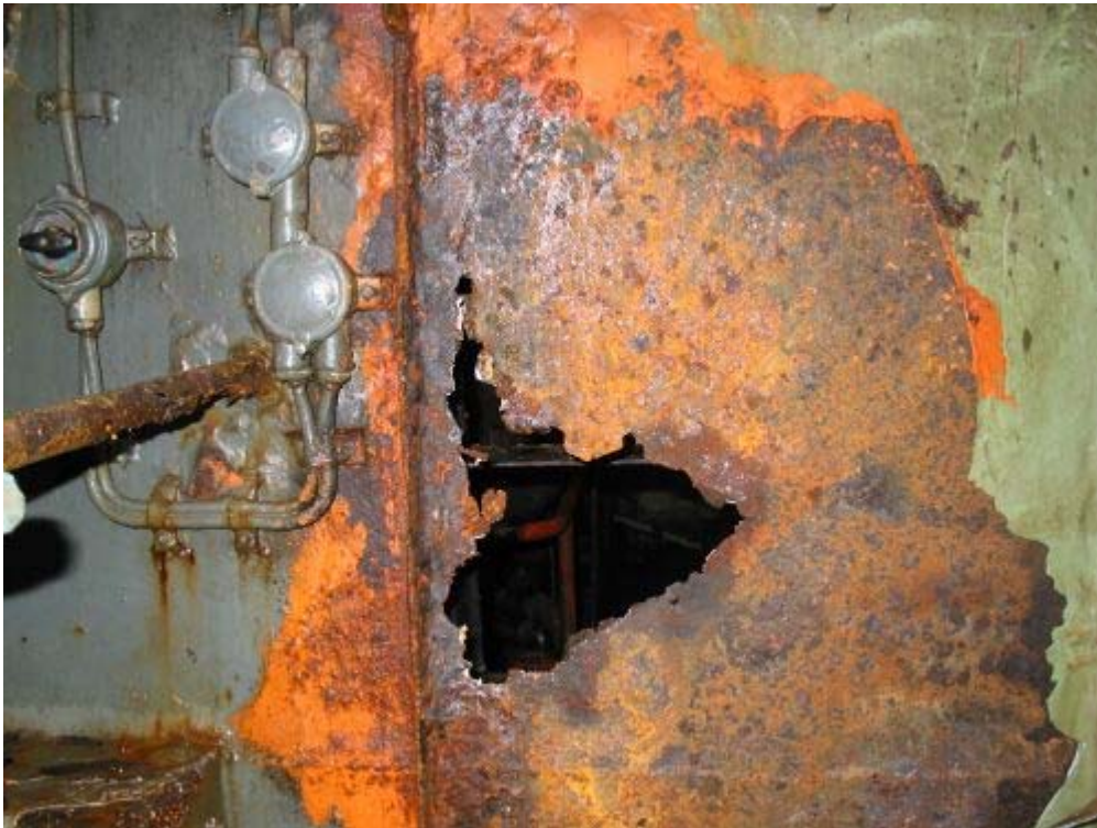
Abbildung 6, Stauraum Stb. vorne