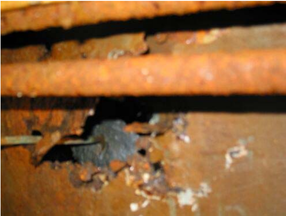
Abbildung 4, Achterpiek Bb. vorne