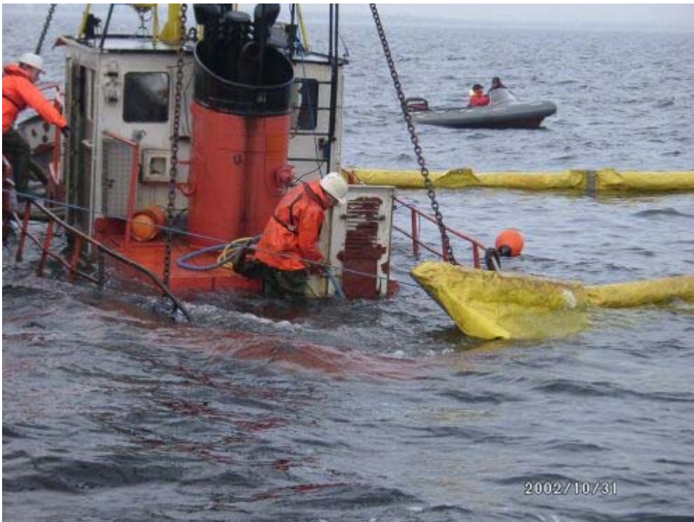
Abbildung 9, Bergung vom 31.10.2002