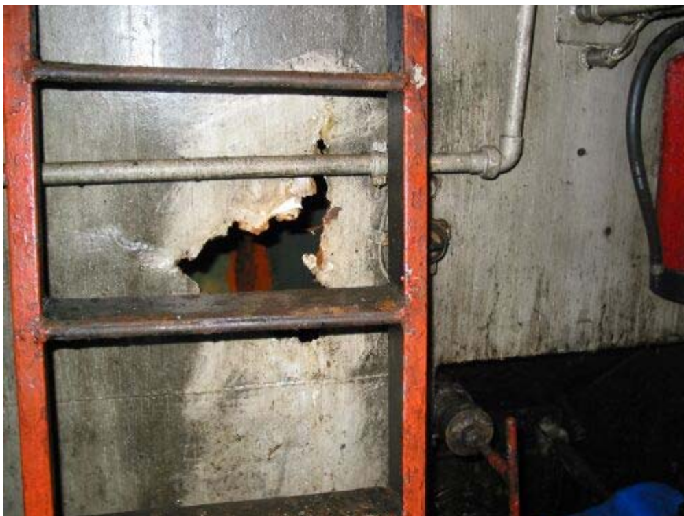
Abbildung 7, Motorenraum Stb. achtern