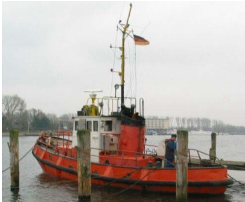
Abbildung 1, Stadt Arnis